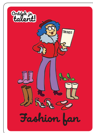
16 Talentkaarten, A5