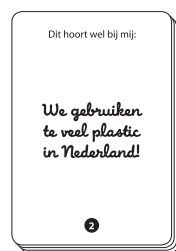
128 Kaartjes met stellingen, A7